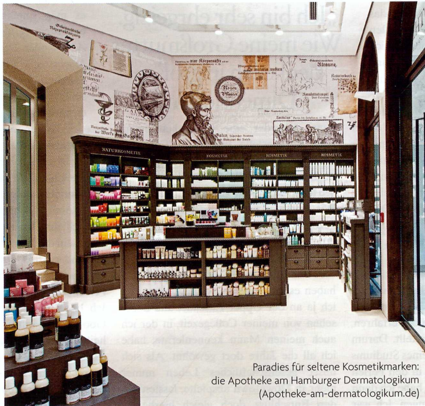
Paradies für seltene Kosmetikmarken: die Apotheke am Hamburger Dermatologikum (Apotheke-am-dermatologikum.de)